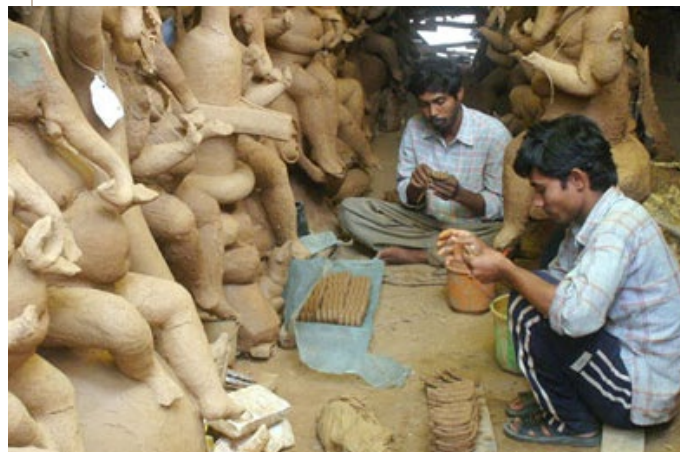
Los fabricantes de ídolos se preparan para Ganesha Chaturthi

¿Cómo puede usar su creatividad para glorificar a Dios?